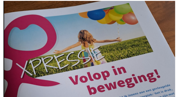
Voorbeeld van de Xpressie

Meerdere keren per jaar krijgen leden digitaal en/of op papier ons blad met informatie over activiteiten en het laatste nieuws.