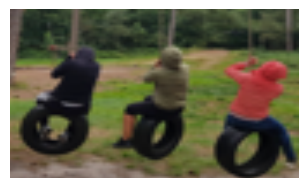
* Foto gemaakt tijdens een meidenweekend van Turner Contact Nederland

Vrouwen met SvT hebben een normale verstandelijke ontwikkeling en het intelligentieniveau is net zo verdeeld als onder de rest van de bevolking. Wel is er vaak sprake van een goede verbale ontwikkeling (taal en denken) en een minder goede performale ontwikkeling (dingen uitvoeren, link leggen tussen wat je ziet, denkt en doet). Ook kan er wat meer moeite zijn met rekenen en ruimtelijk inzicht, plannen en verschillende zaken tegelijk doen. Een goede begeleiding kan hierbij ondersteuning bieden. Er zijn aanwijzingen dat problemen in aandacht en/of hyperreactiviteit vaker voorkomen.