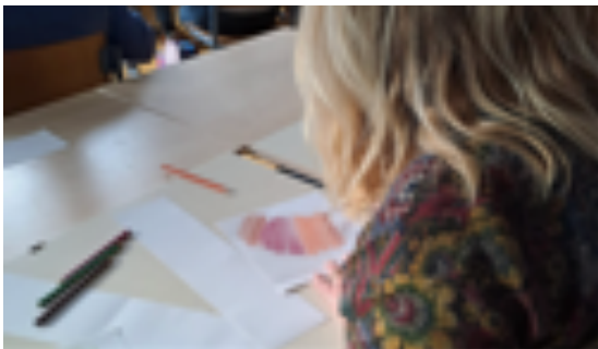
* Foto gemaakt tijdens een familiedag van TCN

Eenmaal per jaar wordt er voor de leden een familiedag georganiseerd. Tijdens deze bijeenkomst wordt men op de hoogte gehouden over ontwikkelingen op medisch gebied, behandelings- en begeleidingsmogelijkheden en is er veel ruimte voor persoonlijk contact. Daarnaast worden er per regio verschillende bijeenkomsten georganiseerd door onze cliëntondersteuners.