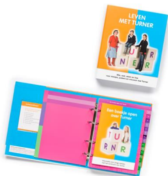
Informatiemap 'Leven met Turner'

Naast het digitaal overbrengen van informatie blijven we werken aan onze periodieke informatiebron, het kwartaalblad Xpressie. Nog altijd wordt de doelstelling om vier keer per jaar de ontwikkelingen binnen de vereniging te verspreiden goed gewaardeerd. Het blad voorziet daarmee nog altijd in een vraag vanuit de leden, maar ook deze ontkomt niet aan digitalisering. Op verzoek van verschillende leden wordt deze nu per mail verspreid. Voor de oudere generatie is de mogelijkheid om een papieren exemplaar te ontvangen nog altijd aan te vragen via het administratiekantoor APN-backoffice.